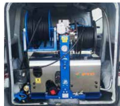
Version with 2 HP hose reel HP (electric and manual) Versione con 2 avvolgitubo HP (elettrico e manuale)