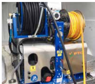
Version with electric powered hose reel Versione con avvolgitubo elettrico