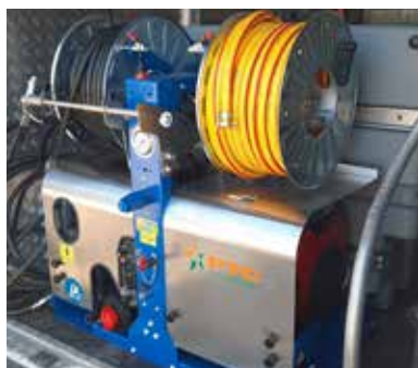
Standard version Versione Standard